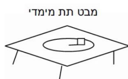
מבט תת מימדי